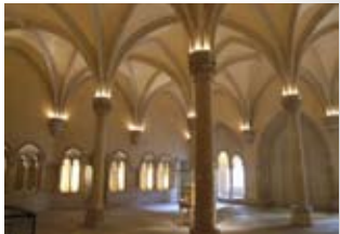
Die Basilika Saint-Remi REIMS