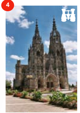
Die Basilika Notre-Dame L'EPINE