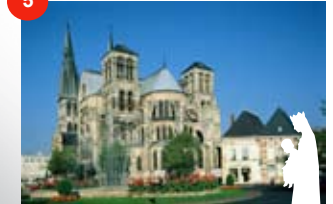
Die Kirche Notre-Dame- en-Vaux CHALONS-EN-CHAMPAGNE