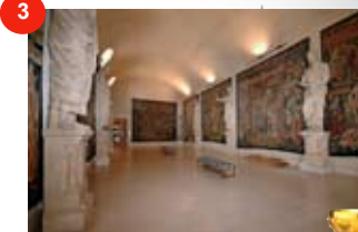
Der Tau Palast REIMS